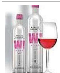
Le bottiglie in alluminio di Caldirola

VERONA - Di vino di produzione biologica e biodinamica si parla da anni e solo ora sta uscendo dalla condizione di produzione di nicchia e riservata agli appassionati del cibo biologico. Tra le altre, a Vinitaly è stata presentata l'Associazione dei produttori di vino da uve di agricoltura biologica della Sicilia, promossa dalle Città del vino, con otto aderenti. Il fatto nuovo è l'attenzione «ecologica» a tutto ciò che sta intorno al vino in sé, quindi imballaggi, etichette, tappi e bottiglie. La spinta viene dagli stessi consumatori: dopo decenni di dibattiti su argomenti ecologici, il tema è stato interiorizzato e oggi incominciano a vedersi le conseguenze anche sul piano della domanda. Ora alle aziende viene chiesta anche la «sostenibilità ambientale».